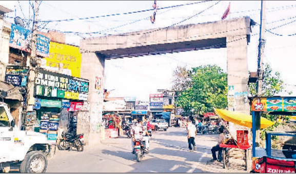
तरावड़ी। शहर के मुख्य करनाली गेट निर्माण कार्य अधर में लटका हुआ।

पिछले 5 साल से शहर के ऐतिहासिक करनाली गेट का निर्माण कार्य अधर में लटक हुआ है। नगर पालिका व ठेकेदार कुंभकर्णी नौद में सोया हुआ है वहीं शहर की जनता प्रशासन के ढीले रवैया से रोष में है और जिला प्रशासन से इस मामले में हस्तक्षेप करके निर्माण कार्य जल्द करवाने की मांग कर चुकी है। नगर पालिका द्वारा पहले से बने शहर के पुराने करनाली गेट को भव्य बना देने की बात कह कर इसकी उखाड़ दिया था जोकि पुराने समय की छोटी इंटों से बना हुआ था जोकि एकमात्र शहर का मुख्य द्वार था लेकिन