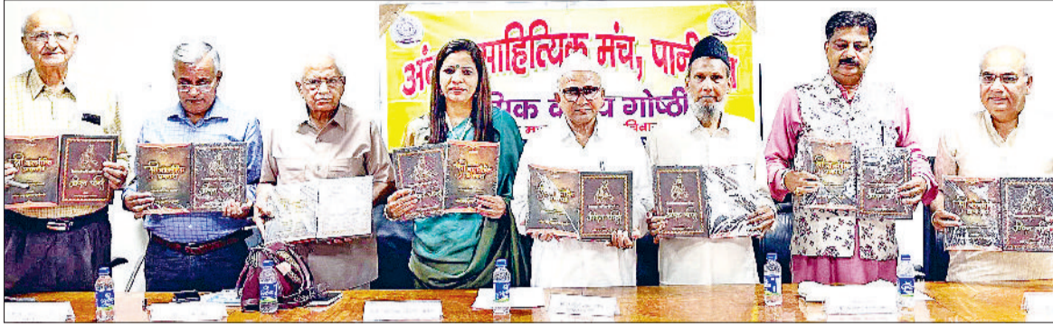
पानीपत। अकन साहित्य मंच की काव्य गोष्ठी में पुस्तकों का विमोचन करते हुए अतिथिगण।