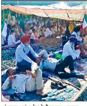
अंबाला। शंभू रेलवे ट्रैक पर आराम फरमाते किसान।

बंद पड़े शंभू बॉर्डर को खुलवाने के लिए अब कारोबारियों ने कसरत शुरू कर दी है। कारोबारियों ने बीते रोज पंजाब एवं हरियाणा हाईकोर्ट के मुख्य न्यायाधीश और भारतीय चुनाव आयोग को इसकी शिकायत भेजी है। व्यापारियों ने कहा कि 10 फरवरी 2024 से शंभू बॉर्डर बंद